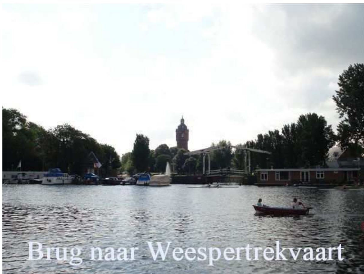
Brug naar Weespertrekvaart