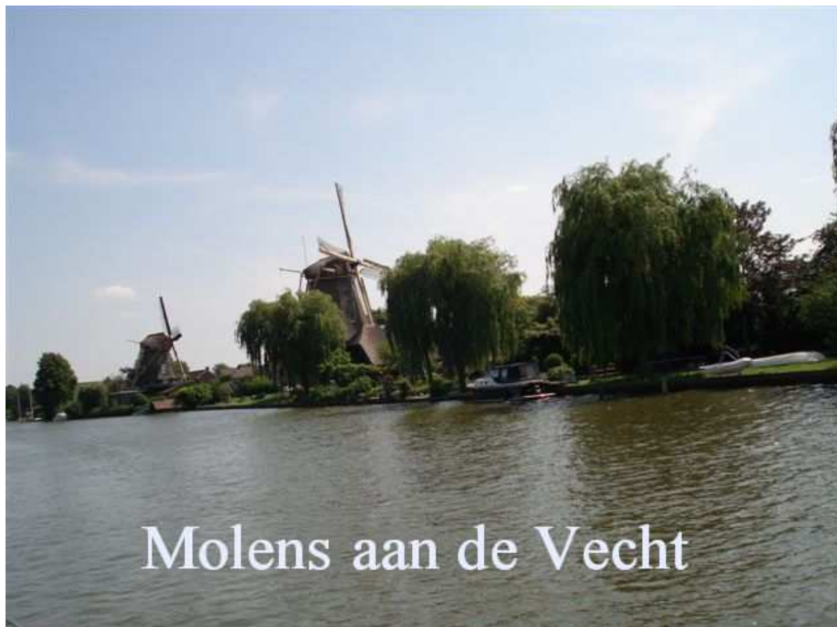
Molens aan de Vecht