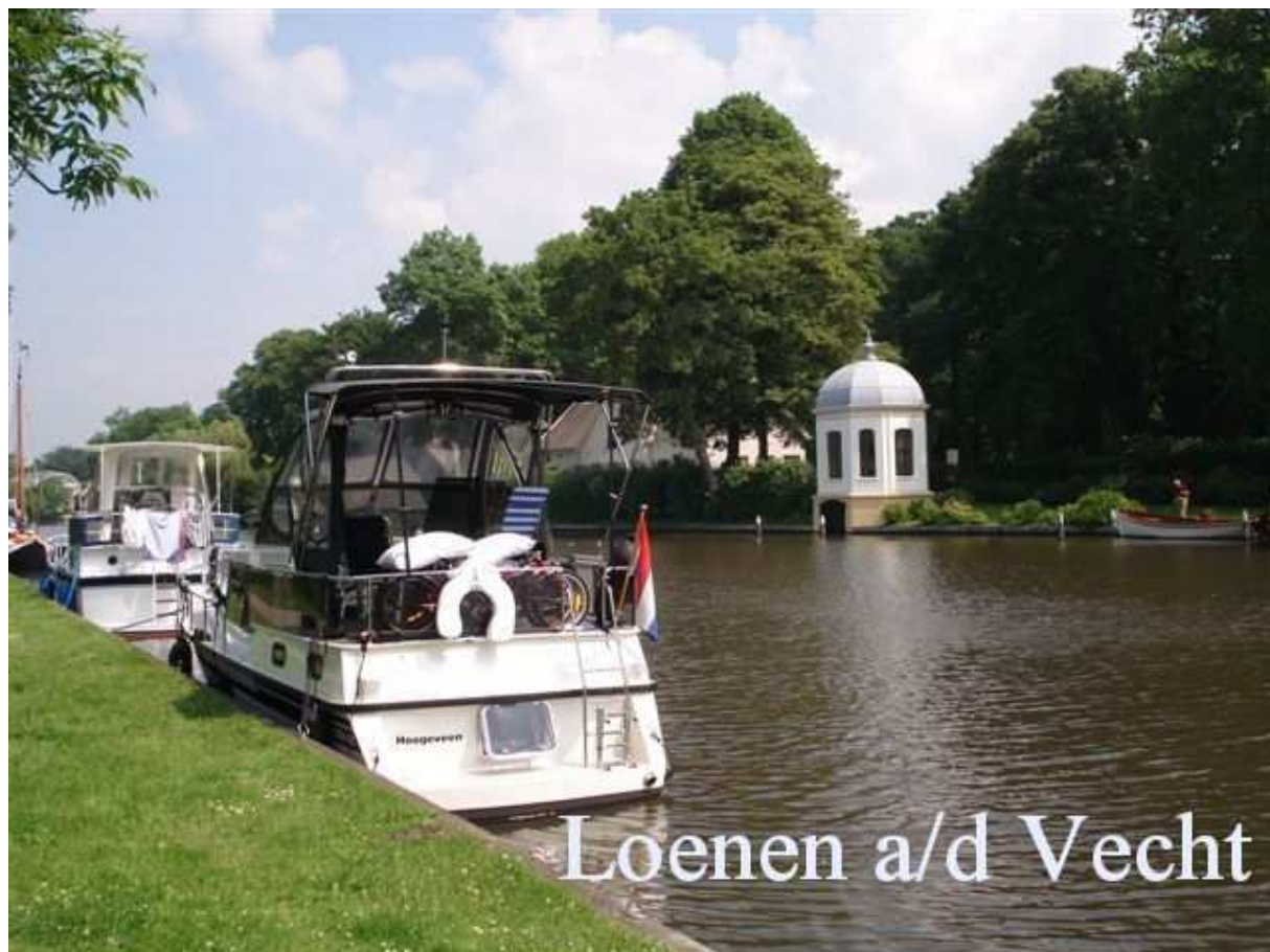
Loenen a/d Vecht