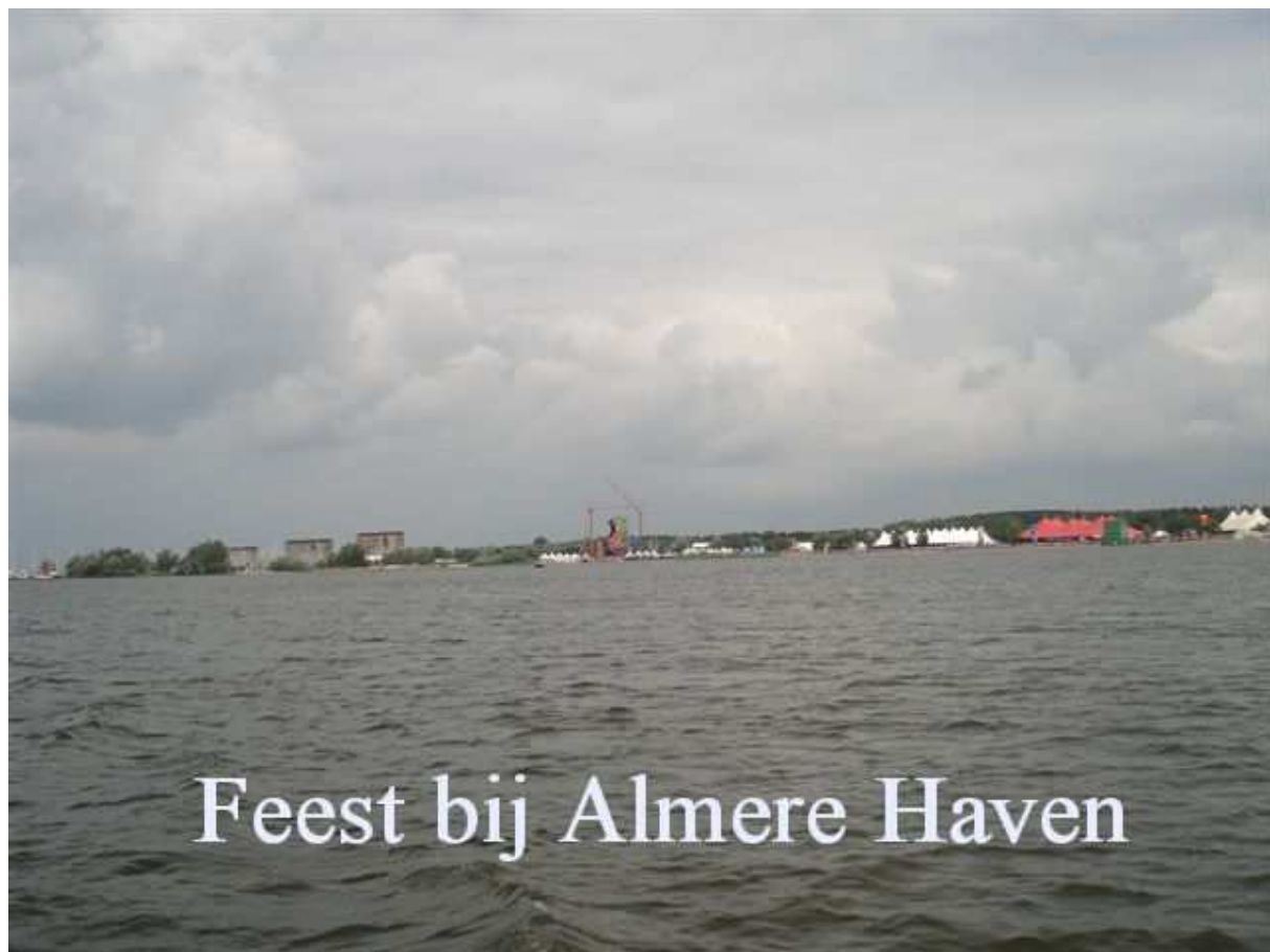
Feest bij Almere Haven