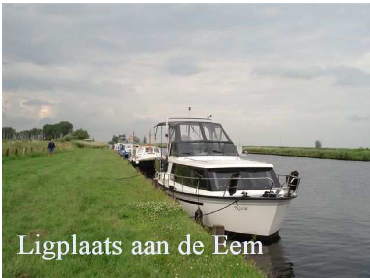
Ligplaats aan de Eem