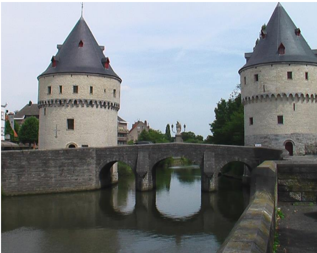
Kortrijk de doorvaart door Doornik

Liggeld € 8,- per nacht, incl. water en stroom. Omdat we vanaf Kortrijk het kanaal Bossuit – Kortrijk op willen varen, moesten we ons eerst telefonisch aanmelden voor de blokvaart (konvooivaart) dat 3 maal daags kan. Op zondag is het gesloten, dus we meldden ons aan voor de vaart van maandag 07:30 uur. Het betekende dat we 2 nachten in Kortrijk bleven, wat geen straf is. Het is één van de oudste steden in België met veel oude kerken, een Belfort, mooie Grote Markt en een mooi winkelcentrum. Zondags hebben we het Budaeiland bezocht, wat gevormd wordt door de splitsing van de Leie. Het gebied langs de rivier is erg modern ingericht met een paar zeer aparte bruggen en zelfs een strandje. Erg strak allemaal, maar wel mooi.