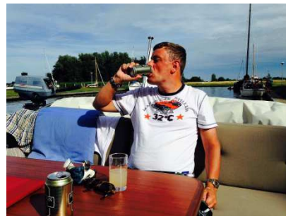
Het was daar warm en dorstig weer.

Vervolgens via Grou en Heeg naar Konijneiland in het Heegermeer voor een weekje rust.