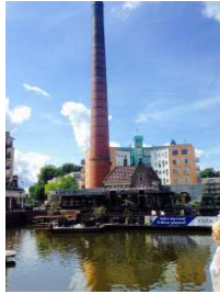
Almelo, mooie jachthaven en verrassend centrum

Coevorden, jachthaven midden in de oude stad