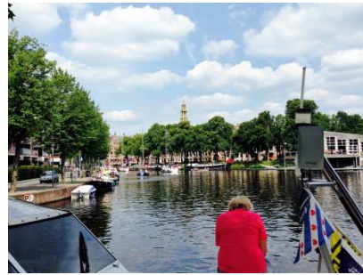
Via het Zuidlaardermeer naar Groningen,

Annerveensche kanaal, restaurant in een oude kerk en brugwachters op scooters